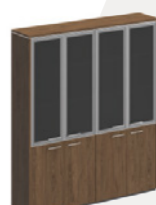
шкаф для документов со стеклянными дверями