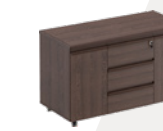
тумба для оргтехники